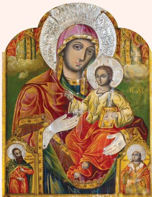
Maica Domnului cu Pruncul