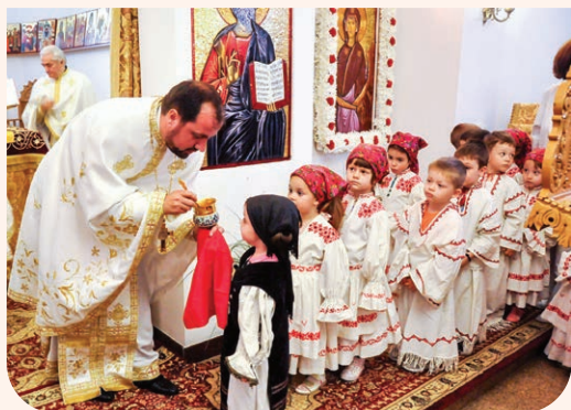
Copii la Sfânta Împărtășanie