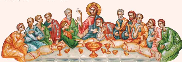
Cina cea de Taină